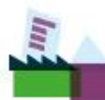
Herontwikkeling voormalige basisschool Bosstraat