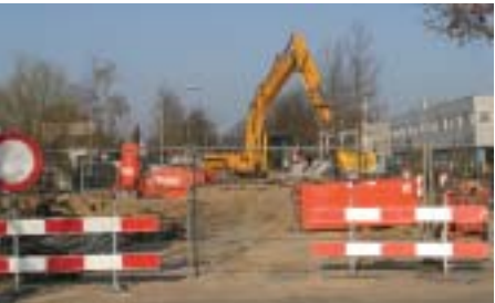
Overlast helaas niet te vermijden...

Veiligheid, ook in het verkeer. De cijfers over de eerste negen maanden van 2003 laten zien dat het aantal verkeersongevallen flink is gedaald: van 245 (jan-sep 2002) naar 148. Dat is het vierde jaar op rij dat er een daling te zien is. Maar het is geen reden tevreden achterover te leunen, want het gaat nog altijd óm de dag een keer mis.